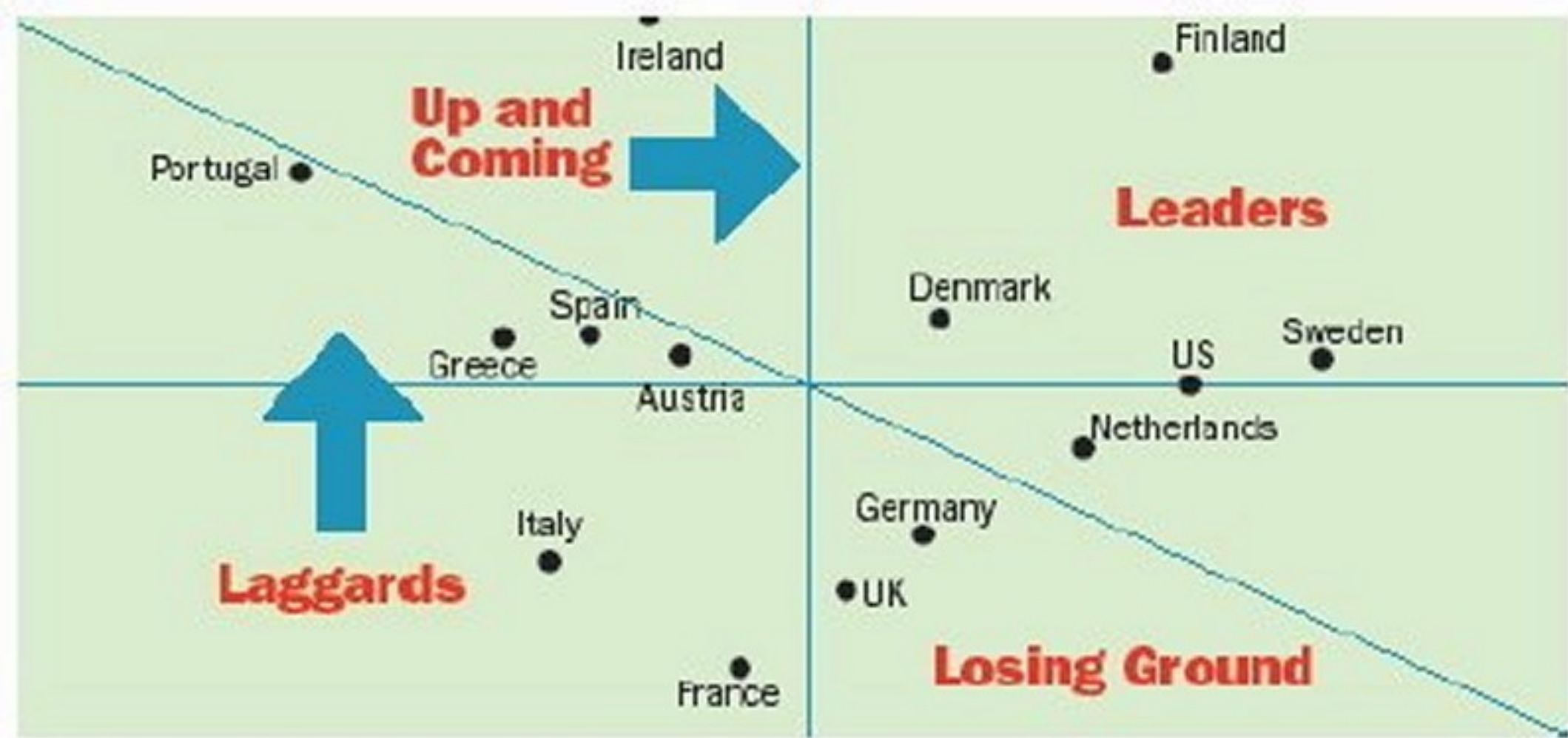
Leaders and laggards in the Euro-creativity matrix